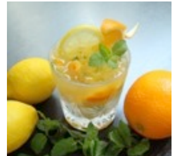
オレンジレモンモヒート

オレンジの甘味、レモンの酸味、そこにミントの爽快感を加えることにより、すっきりとした味わいのモヒート。